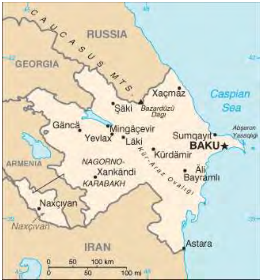
アゼルバイジャン