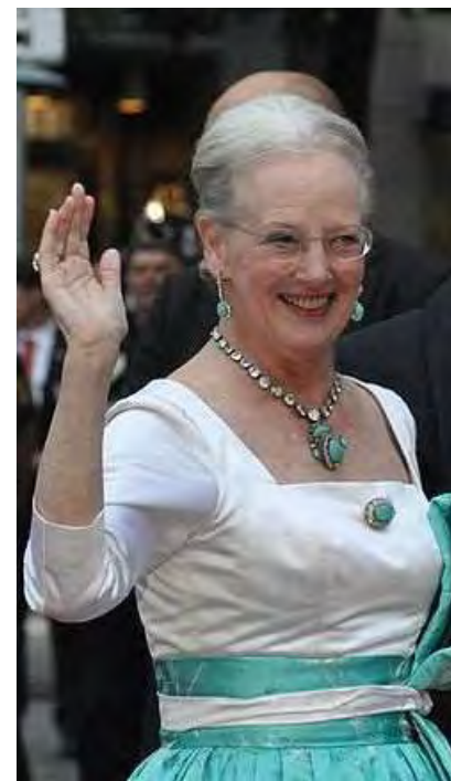
マルグレーテ2世 デンマーク