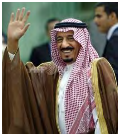
サルマン国王 サウジアラビア