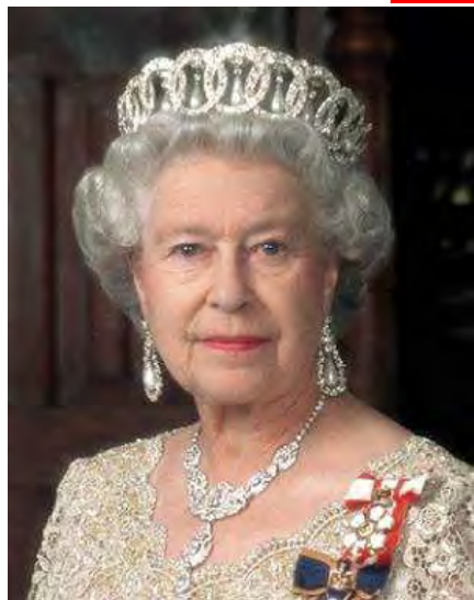
エリザベス女王 イギリス